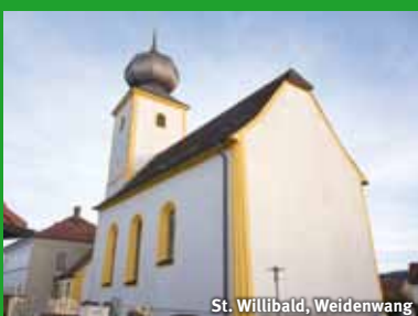
St. Willibald, Weidenwang