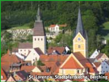
St. Lorenz u. Stadtpfarrkirche, Berching