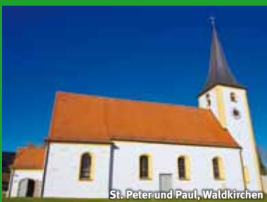
St. Peter und Paul, Waldkirchen