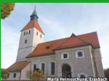
Mariä Heimsuchung, Erasbach