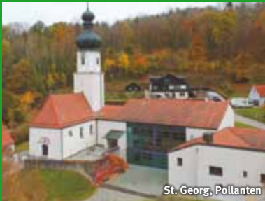
St. Georg, Pollanten