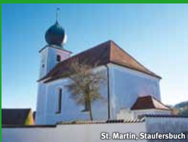
St. Martin, Staufersbuch