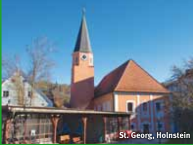
St. Georg, Holnstein