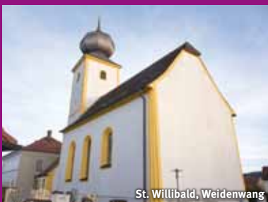
St. Willibald, Weidenwang