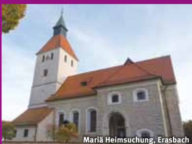
Mariä Heimsuchung, Erasbach