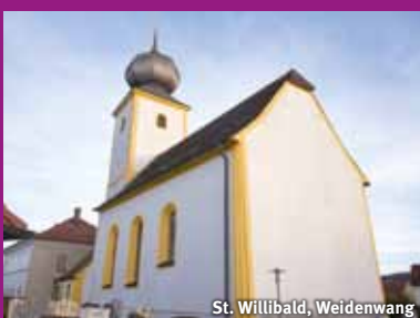
St. Willibald, Weidenwang