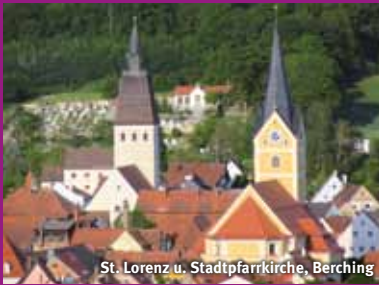
St. Lorenz u. Stadtpfarrkirche, Berching