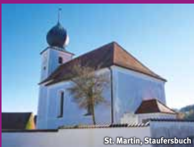
St. Martin, Staufersbuch