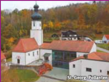
St. Georg, Pollanten