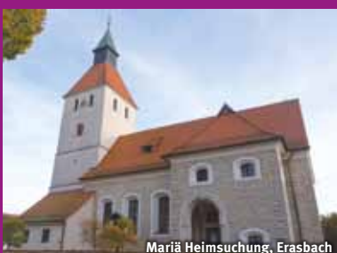
Mariä Heimsuchung, Erasbach