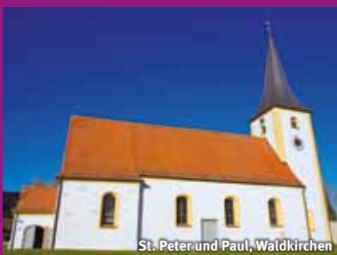
St. Peter und Paul, Waldkirchen