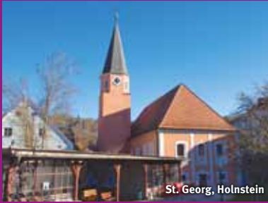
St. Georg, Holnstein