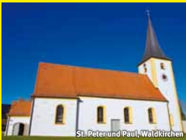
St. Peter und Paul, Waldkirchen