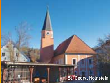
St. Georg, Holstein