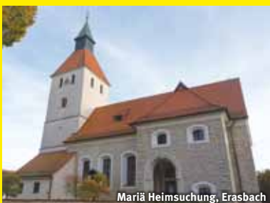
Mariä Heimsuchung, Erasbach