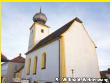
St. Willibald, Weidenwang