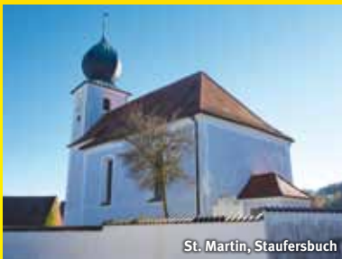
St. Martin, Staufersbuch