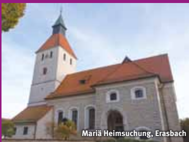
Mariä Heimsuchung, Erasbach