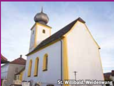
St. Willibald, Weidenwang