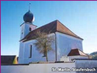
St. Martin, Staufersbuch