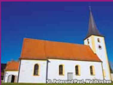
St. Peter und Paul, Waldkirchen