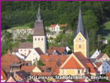
St. Lorenz u. Stadtpfarrkirche, Berching