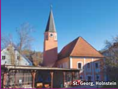
St. Georg, Holnstein