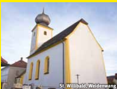
St. Willibald, Weidenwang