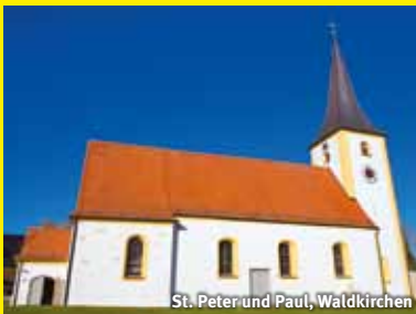
St. Peter und Paul, Waldkirchen