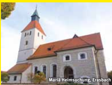
Mariä Heimsuchung, Erasbach