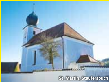
St. Martin, Staufersbuch