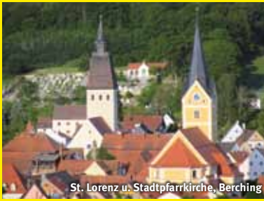
St. Lorenz u. Stadtpfarrkirche, Berching