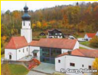
St. Georg, Pollanten