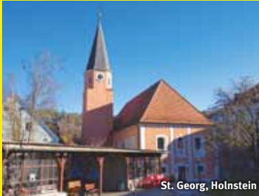
St. Georg, Holnstein